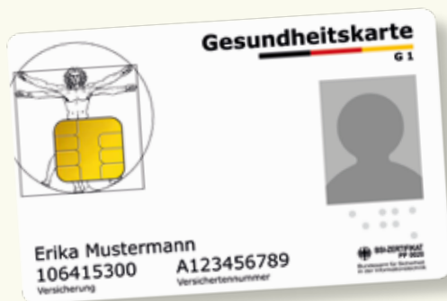
Uzorak zdravstvene kartice

Uvijek ponesite sa sobom svoju elektronsku zdravstvenu karticu kada koristite zdravstvene usluge. Od 1. januara/siječnja 2015. god. ova kartica važi/vrijedi kao isključivi dokaz prava na usluge iz ob(a)veznog zdravstvenog osiguranja. Na elektronskoj zdravstvenoj kartici memorisani/pohranjeni su vaše ime i prezime, datum rođenja i adresa, kao i broj vašeg zdravstvenog osiguranja i vaš osiguranički status (osiguranik, član porodice/obitelji ili penzioner/umirovljenik) kao ob(a)vezni podaci. Osim toga, elektronska zdravstvena kartica sadrži i vašu sliku.